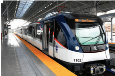
ESTACIÓN IGLESIA DEL CARMEN