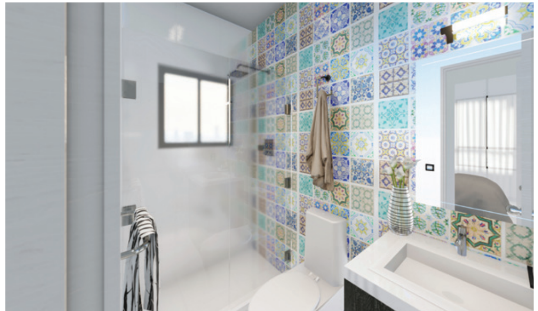
SALÓN - COMEDOR - BAÑO - COCINA - DORMITORIO. LIVING ROOM - DINING ROOM - BATHROOM - KITCHEN - BEDROOM.